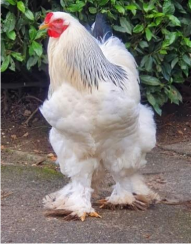
Tierart: Brahma (Huhn)