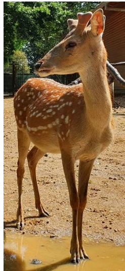
Tierart: Vietnam Sikahirsch